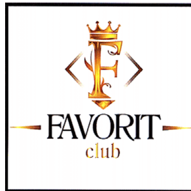
F FAVORIT club